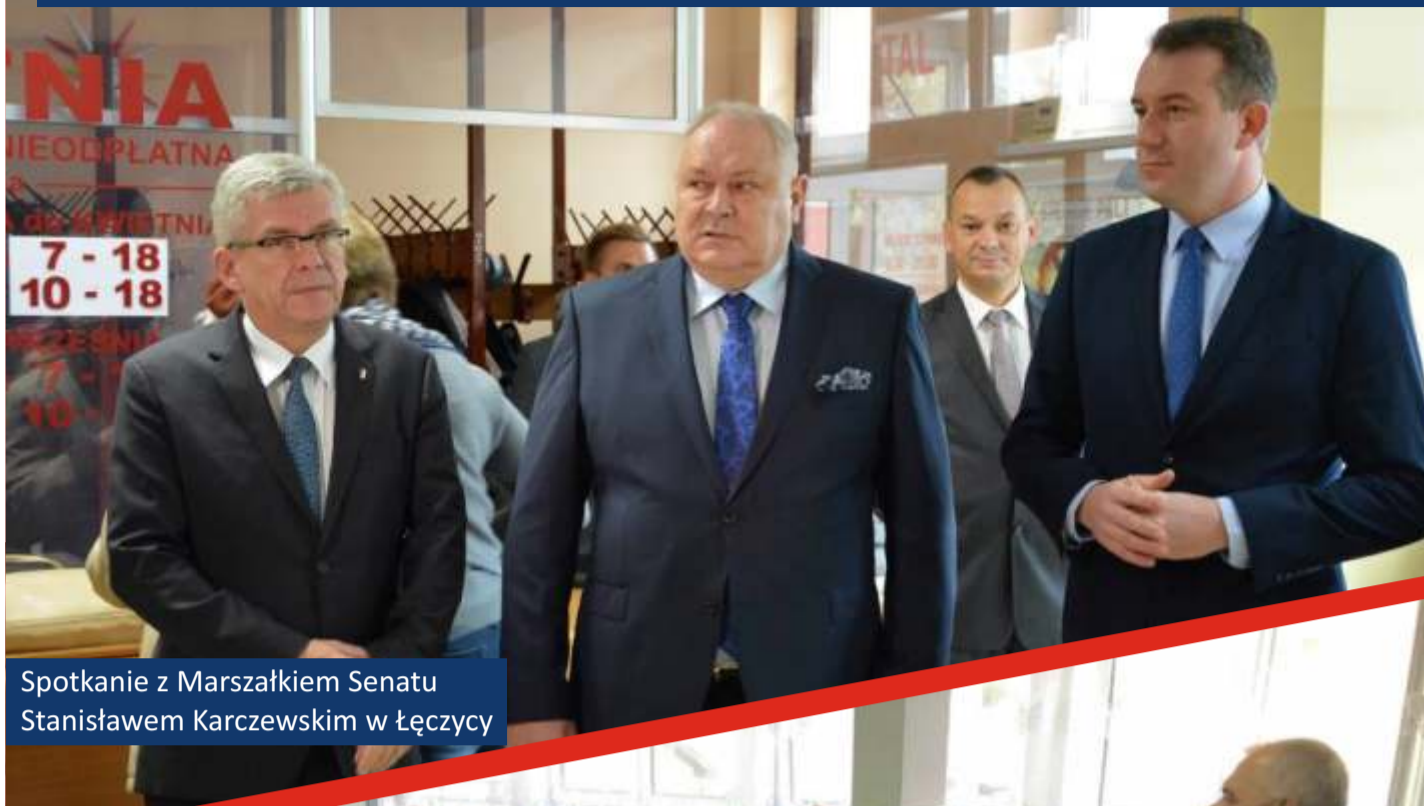
Spotkanie z Marszałkiem Senatu Stanisławem Karczewskim w Łęczycy