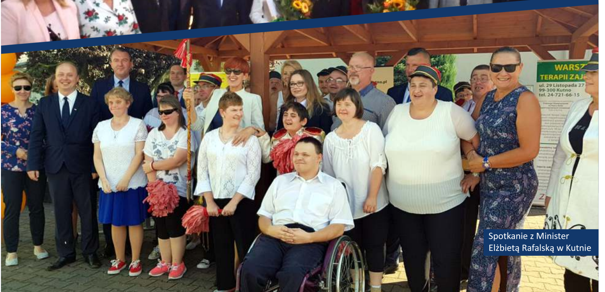
Spotkanie z Minister Elżbietą Rafalską w Kutnie