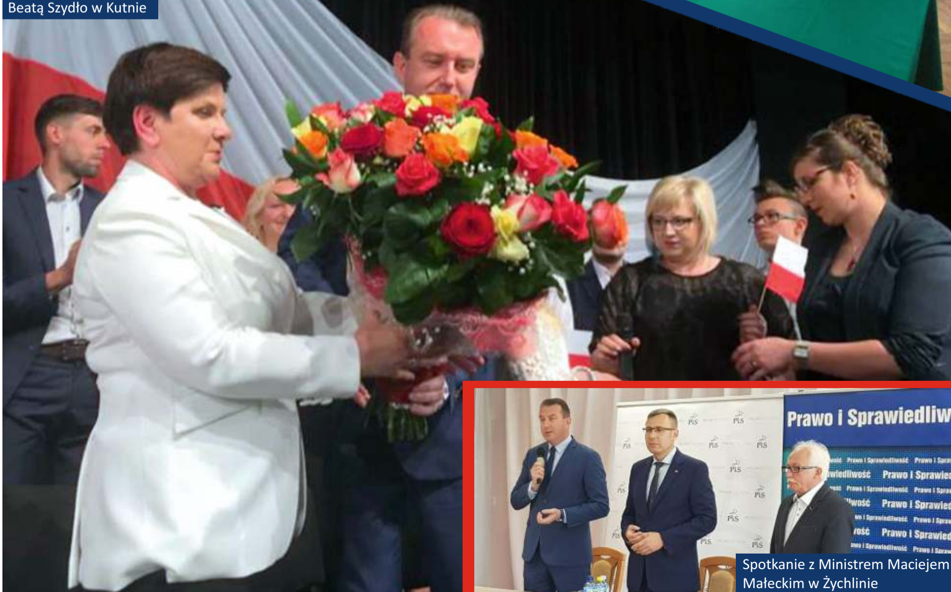
Spotkanie z Premier Beatą Szydło w Kutnie