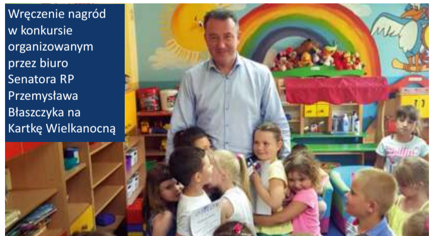
Wręczenie nagród w konkursie organizowanym przez biuro Senatora RP Przemysława Błaszczyka na Kartkę Wielkanocną