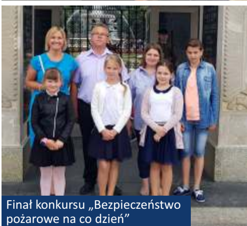
Finał konkursu „Bezpieczeństwo pożarowe na co dzień”