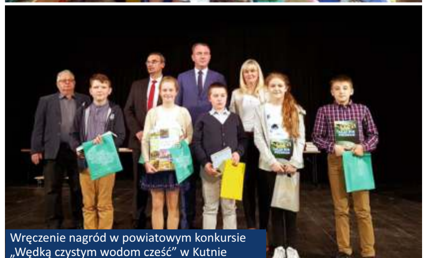
Wręczenie nagród w powiatowym konkursie „Wędką czystym wodom cześć” w Kutnie