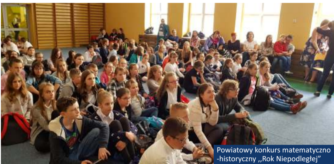
Powiatowy konkurs matematyczno-historyczny „Rok Niepodległej”

Przeprowadzone zostały również inne konkursy w moim okręgu wyborczym, organizowane przez Szkoły, Domy Kultury itp. Były to m.in. konkursy: