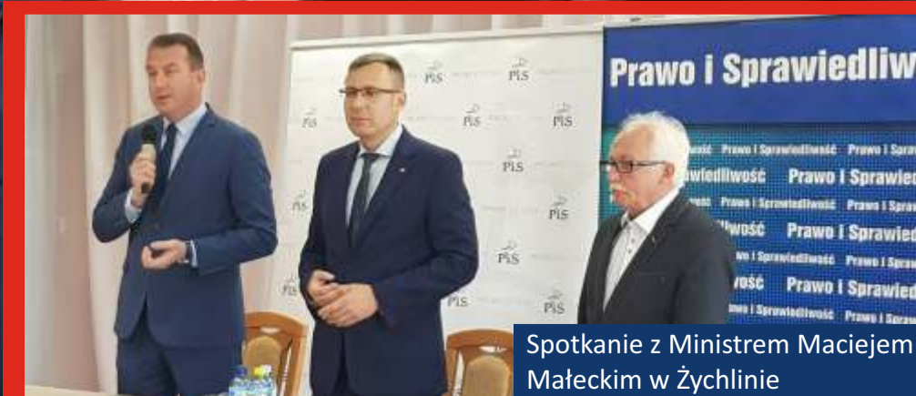
Spotkanie z Ministrem Maciejem Mąteckim w Żychlinie