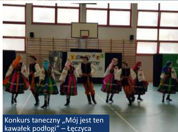
Konkurs taneczny „Mój jest ten kawałek podłogi” – Łęczycza