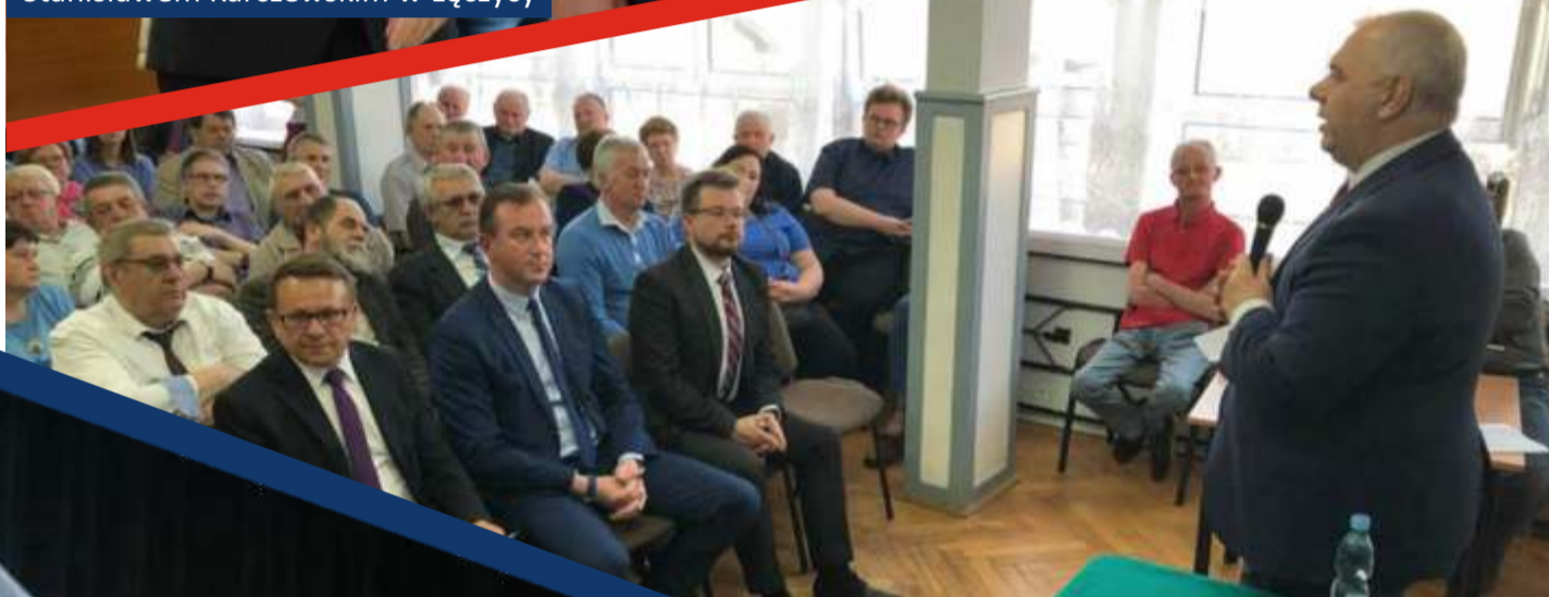
Spotkanie z Wicepremierem Jackiem Sasinem w Poddębicach