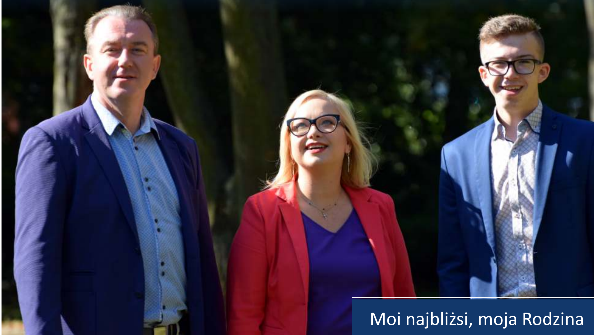
Moi najbliżsi, moja Rodzina

Każdego dnia uświadamiam sobie, że jestem szczęśliwym człowiekiem. Jestem zdrowy. Mam wspaniałą pracę, która przynosi i mam nadzieję przynosić będzie, wiele satysfakcji oraz cudowną rodzinę, która zawsze daje mi wsparcie i ostoję.